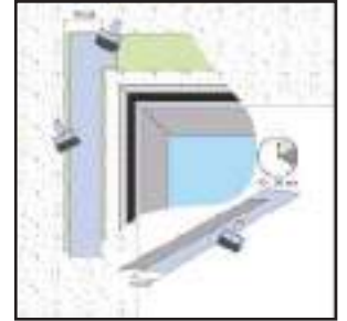
Наносьте клей валиком або пензлем на обидві поверхні.