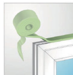
Повна герметизація периметра за одне застосування